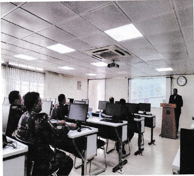
অত্র দপ্তরের তত্ত্বাবধানে অনুষ্ঠিত সেবা প্রদান প্রতিশ্রুতি বিষয়ে সভার স্থিরচিত্র।