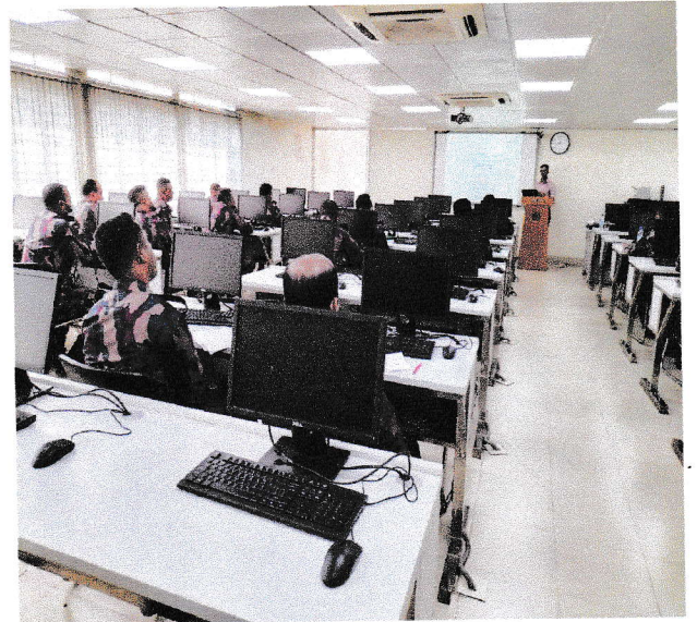
অত্র দপ্তরের তত্ত্বাবধানে অনুষ্ঠিত সেবা প্রদান প্রতিশ্রুতি বিষয়ে সভার স্থিরচিত্র।