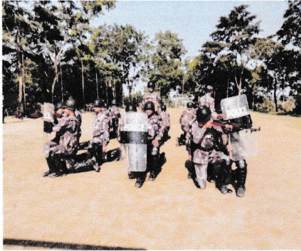
বাঘাইহাট ব্যাটালিয়ন (৫৪ বিজিবি) এর তত্ত্বাবধানে দাঙ্গা নিয়ন্ত্রণ ক্যাডার পরিচালনার স্থিরচিত্র।