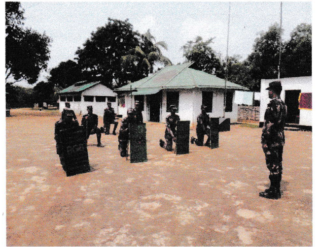
খাগড়াছড়ি ব্যাটালিয়ন (৩২ বিজিবি) এর ডাইনচন্দ্রবাড়ী বিওপিতে দাঙ্গা নিয়ন্ত্রণ ক্যাডার পরিচালনার স্থিরচিত্র।