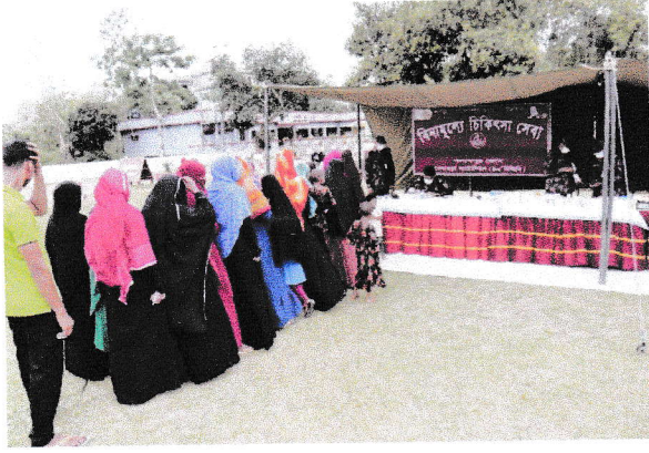
খেদাছড়া ব্যাটালিয়ন (৪০ বিজিবি) কর্তৃক আয়োজিত মেডিক্যাল ক্যাম্পেইন স্থিরচিত্র।