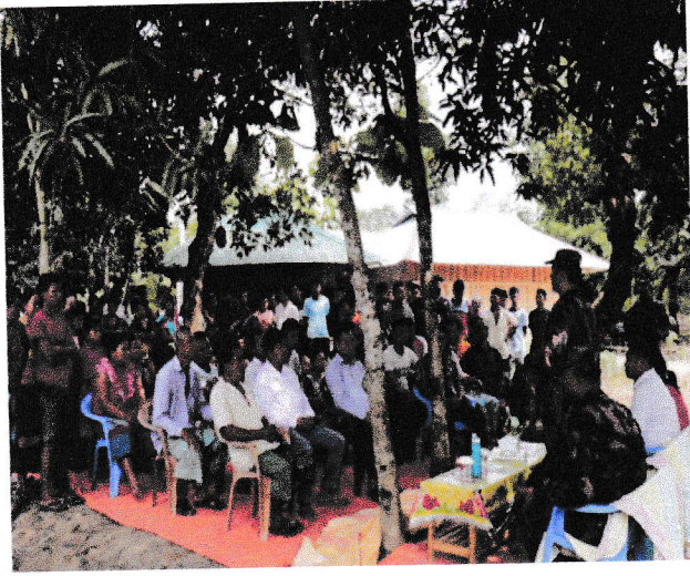
খাগড়াছড়ি ব্যাটালিয়ন (৩২ বিজিবি) এর তত্ত্বাবধানে অনুষ্ঠিত সেবা প্রদান বিষয়ে স্টেকহোল্ডারগণের সমন্বয়ে অবহিতকরণ সভার স্থিরচিত্র