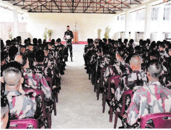
গুইমারা সেক্টরের সার্বিক ব্যবস্থাপনায় বিসিএম গ্রেড-২ (ল্যাঃ নাঃ জিডি)-০২/২৩ কোর্স পরিচালনার স্থিরচিত্র।