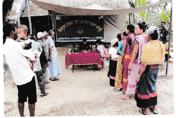
খাগড়াছড়ি ব্যাটালিয়ন (৩২ বিজিবি) কর্তৃক আয়োজিত মেডিক্যাল ক্যাম্পেইন স্থিরচিত্র।