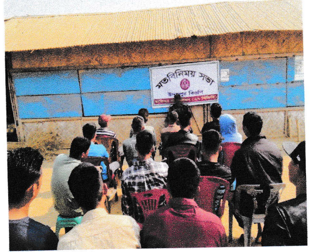
মারিশ্যা ব্যাটালিয়ন (২৭ বিজিবি) এর তত্ত্বাবধানে অনুষ্ঠিত সেবা প্রদান বিষয়ে স্টেকহোল্ডারগণের সমন্বয়ে অবহিতকরণ সভার স্থিরচিত্র