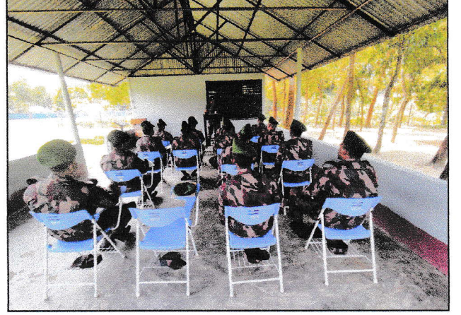
রামগড় ব্যাটালিয়ন (৪৩ বিজিবি) এর ব্যবস্থাপনায় ০৩ (তিন) সপ্তাহব্যাপী মানচিত্র পঠন সতেজকরণ প্রশিক্ষণ-০১/২০২৩ পরিচালনার স্থিরচিত্র।