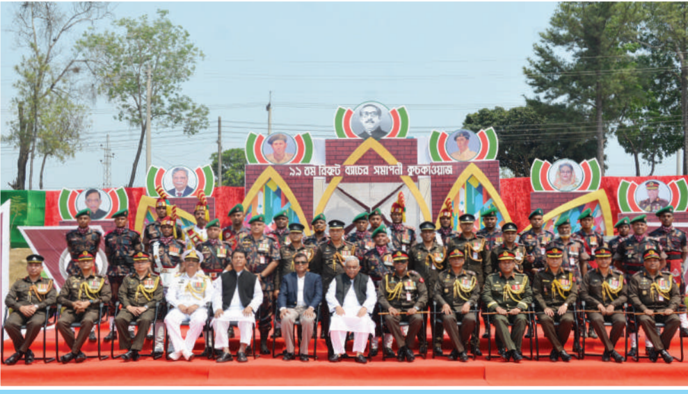
কুচকাওয়াজ শেষে ফটোসেশনে মাননীয় স্বরাষ্ট্রমন্ত্রী