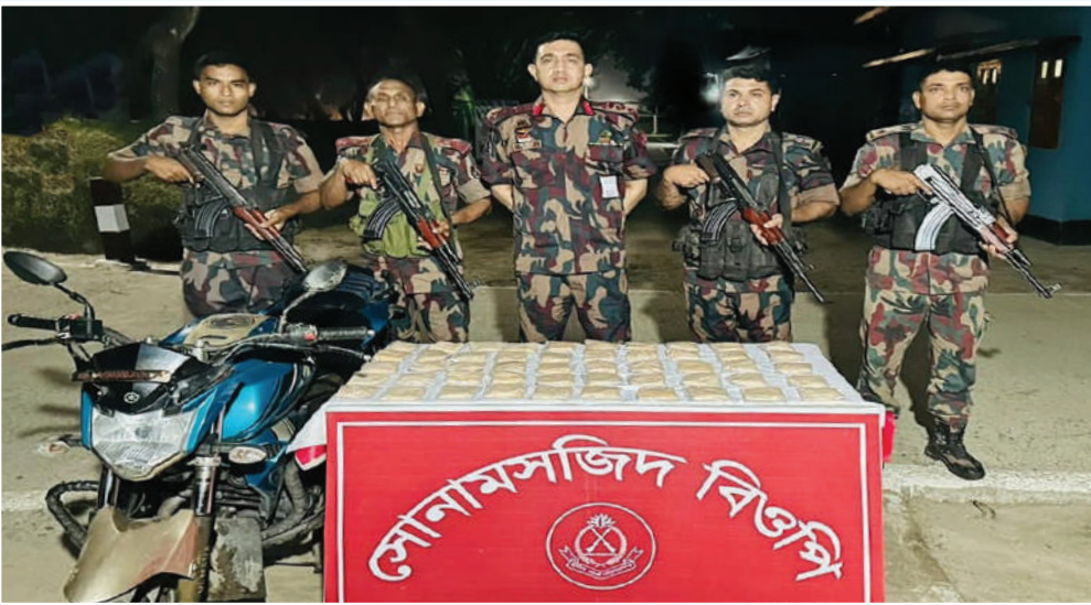
০৩ মে ২০২৩ তারিখে রহনপুর ব্যাটালিয়ন (৫৯ বিজিবি) এর সোনামসজিদ বিওপি'র টহলদল মাদক বিরোধী অভিযান পরিচালনা করে ০৫ কেজি হেরোইন ও ০১টি মোটর সাইকেল জব্দ করে