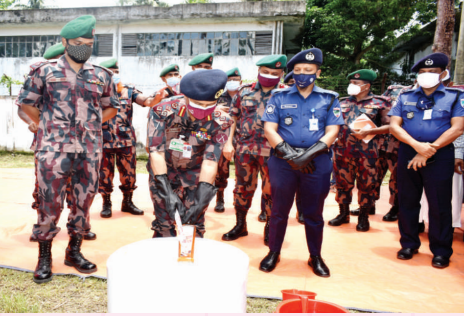
১১ জুলাই ২০২১ তারিখে সাতক্ষীরা ব্যাটালিয়ন (৩৩ বিজিবি) এর ব্যাটালিয়ন সদরে বিভিন্ন প্রকার মাদকদ্রব্য ধ্বংস করা হয়। যার আনুমানিক সিজার মূল্য ৪,২৩,৭৯,০৫০/- টাকা।