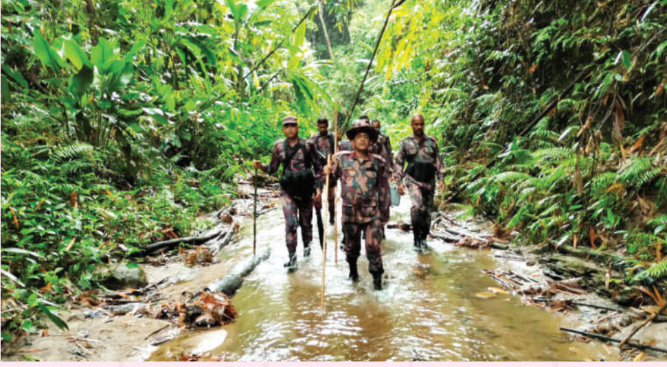
০২ জুলাই ২০২১ তারিখে অধিনায়ক, বাঘাইহাট ব্যাটালিয়ন (৫৪ বিজিবি) এর নেতৃত্বে গন্ডাছড়াপাড়া এবং করলাছড়াটিলা বিওপি'র মধ্যে যৌথ টহল পরিচালনার স্থিরচিত্র।