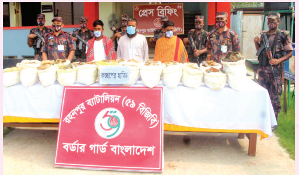
০২ জুলাই ২০২১ তারিখে রহনপুর ব্যাটালিয়ন (৫৯ বিজিবি) এর অধিনায়ক কর্তৃক ভোলাহাট বিওপি'র দায়িত্বপূর্ণ এলাকায় কুমিরজান গ্রামে একটি বিশেষ অভিযান পরিচালনা করে ০৩ জন আসামিসহ ১৩৫ কেজি কচ্ছপের হাড় আটক করতে সক্ষম হয়। যার সিজার মূল্য ২,০২,৫০,০০০/- টাকা।