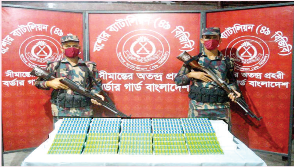
০২ জুলাই ২০২১ তারিখে যশোর ব্যাটালিয়ন (৪৯ বিজিবি) এর নাভারণ এলাকায় একটি বিশেষ অভিযান পরিচালনা করে ১০,০০০ পিস ইন্টারন্যাশনাল কলিং কার্ড (ইউএসডি) উদ্ধার করতে সক্ষম হয়। যার সিজার মূল্য ৪,২৫,০০,০০০/- টাকা।