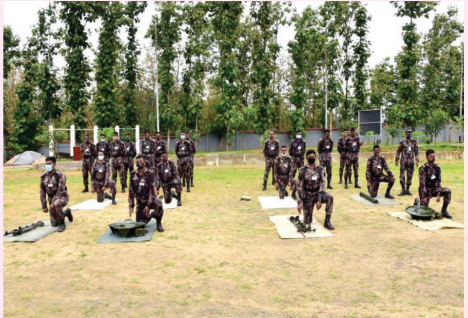
০৪-১৫ জুলাই ২০২১ তারিখ পর্যন্ত রুমা ব্যাটালিয়ন (৯ বিজিবি) এর তত্ত্বাবধানে পরিচালিত মর্টার ক্যাডার - ০২/২০২১ এর ক্লাস চলাকালীন স্থিরচিত্র।