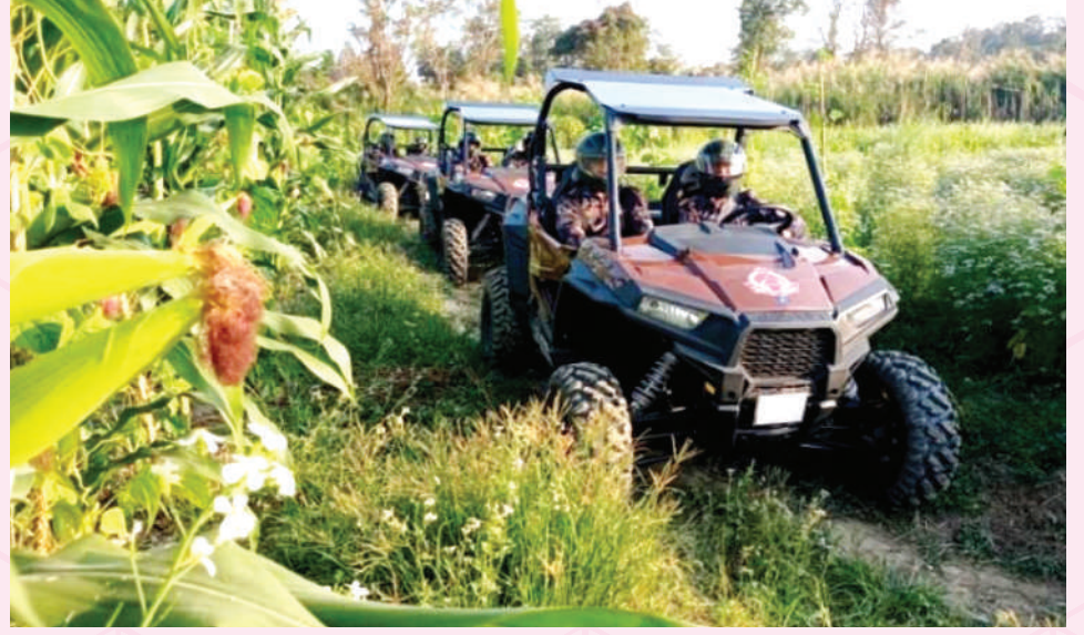
ছোটহরিণা ব্যাটালিয়ন (১২ বিজিবি) এর থেগামুখ বিওপি'র দায়িত্বপূর্ণ এলাকায় ATV যোগে টহল পরিচালনার স্থিরচিত্র।