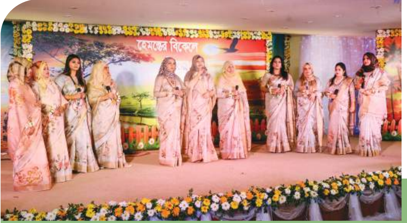
গত ১৩ নভেম্বর ২০১৯ তারিখে সীমান্ত অফিসার্স লেডিস ক্লাবে আয়োজিত “সাংস্কৃতিক ও বরণ-বিদায়ী সংবর্ধনা অনুষ্ঠান”এ কোরাস গান পরিবেশন করে সীমান্ত অফিসার্স লেডিস ক্লাব এর সদস্যরা ।